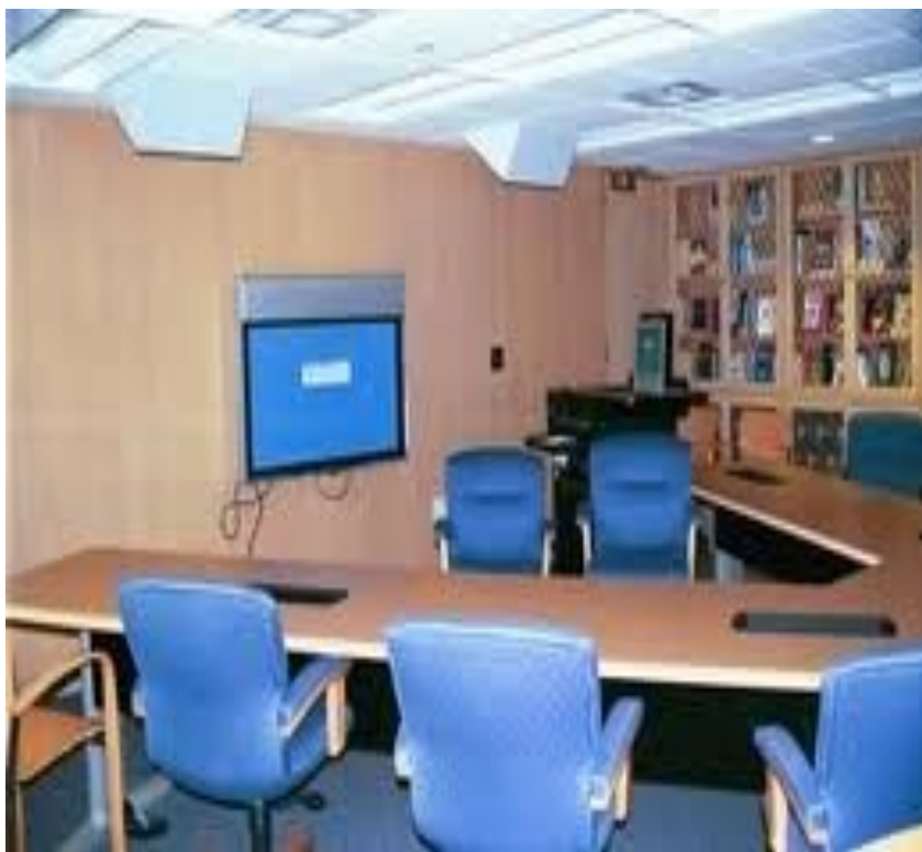
Nella sala Reference un nuovo modo di studiare e apprendere : Information commons